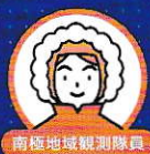
南極地域観測隊員

放送大学で学ぶ人は、ライフスタイルも学ぶ目的も多種多様。海外からの受講を体験された方の声をお届けします。