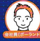
会社員(ポーランド)

海外にいながら日本語で大学の授業が受けられるのは、本当に価値のあることだと思います。勉学を通して成長できるという点で、放送大学での学びは私にとって心の支えでもありました。