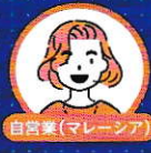
自営業(マレーシア)

「南極で学ぶ」という大胆な発想に惹かれ、受講してみようと思いました。ブリザードや天候が悪く外に出られない日などに時間を見つけて、学びを積み重ねたいです。